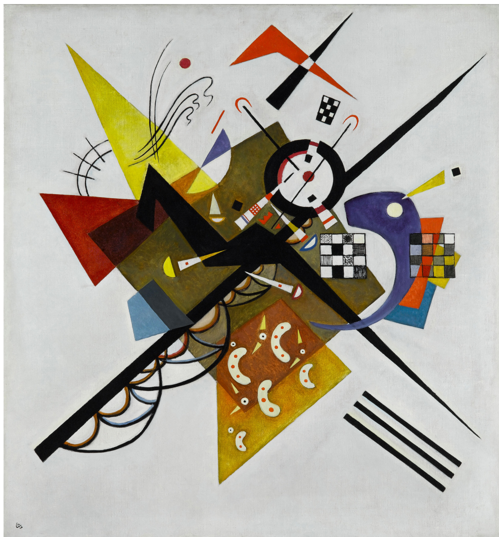
Auf Weiss II (En blanco II) . Vassily Kandinsky, 1923. Óleo sobre lienzo. 105 x 98 cm. Colección Centro Pompidou, Museo nacional de arte moderno, París. Donación de Nina Kandinsky en 1976. © Vassily Kandinsky, VEGAP, Madrid, 2015

Se estableció en un apartamento en Neuilly-sur-Seine, cerca del Bois de Boulogne, con vistas al Sena. Le encantaba la luz cristalina y límpida, que suavizó su paleta. Al mismo tiempo, también por la influencia de sus amigos surrealistas Jean Arp y Joan Miró, sus pinturas y obras sobre papel mostraron una proliferación de formas biomórficas, amebas, criaturas de las profundidades, embriones e insectos ( Composición IX , 1936, Conjunto colorido , 1938; Cielo azul , 1940; Una celebración íntima , 1942). Kandinsky se sumergió en este microcosmos también con el objetivo de escapar de la angustia de la guerra. Murió el 13 de diciembre de 1944 sin ver el final de la contienda